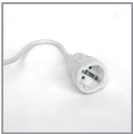
B 08 Steckdose