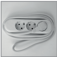
B 09 Dreifachsteckdose