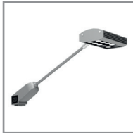
B 04 LED-Langarmstrahler