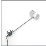
B 03 Langarmstrahler