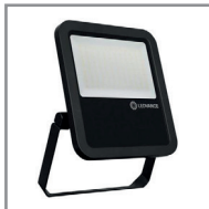
B 07 LED-Floodlight