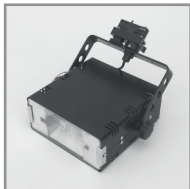
B 06 HQI-Strahler