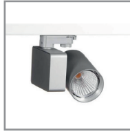
B 02 LED-Strahler