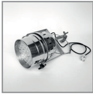
B 05 LED-Bühnenscheinwerfer